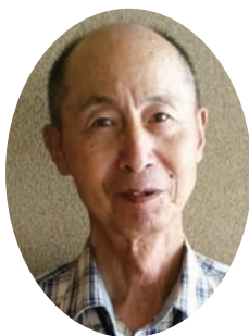
れんげん修了者の集い会長

方々との貴重なご縁を大切に、楽しい若婦の会の活動にも繋げていきたいと思えます。どうぞよろしくお願い致します。