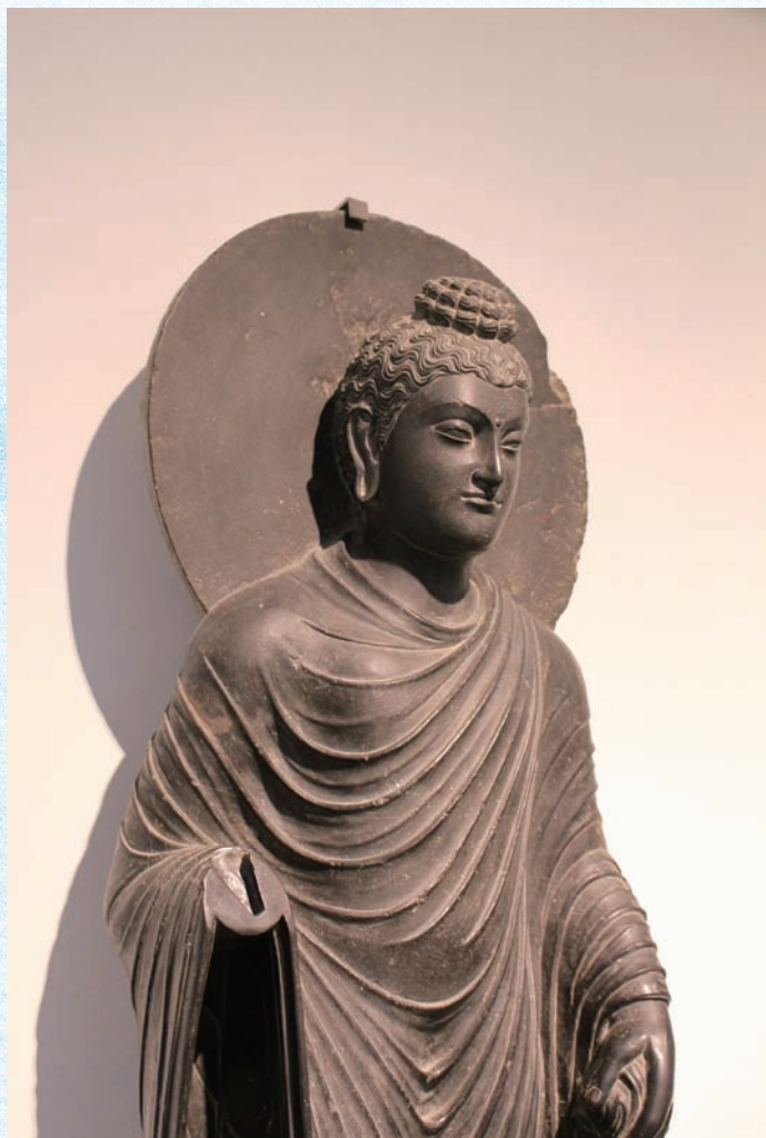
ガンダーラ仏立像(部分)